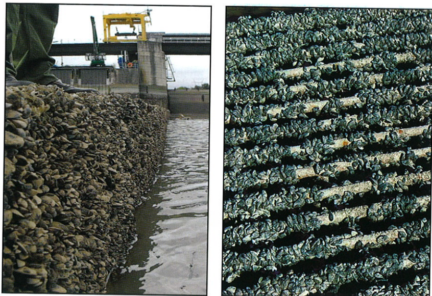
Figura 3. Afección de Dreissena polymorpha en diversas instalaciones.

fectadas por la plaga (Figura 3). Inicialmente, un solo individuo se instala en una superficie dura; después, otros colonizan el espacio a su alrededor e incluso crecen unos sobre otros. Su densidad aumenta obturando y cegando por completo tuberías, rejillas, orificios y en general, todas aquellas aberturas por donde hay paso de corriente de agua. En los casos en los que no hay un cegamiento completo, las tuberías pierden capacidad debido a la pérdida de sección y al incremento de la rugosidad. Además, se incrementa el riesgo de corrosión-abrasión de las conducciones y aumentan las cargas en las bombas.