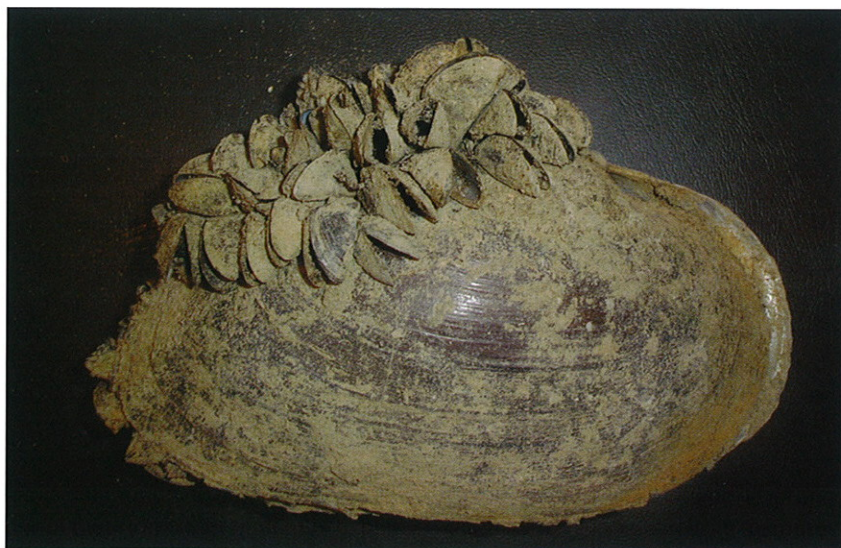
Figura 2. Uniónido afectado por individuos de D. polymorpha .

cuenca del Ebro se han registrado densidades de hasta 61.200 ejemplares/m 2 . Estas elevadas densidades son la principal causa de los graves impactos ecológicos y socio-económicos que ocasiona la especie.