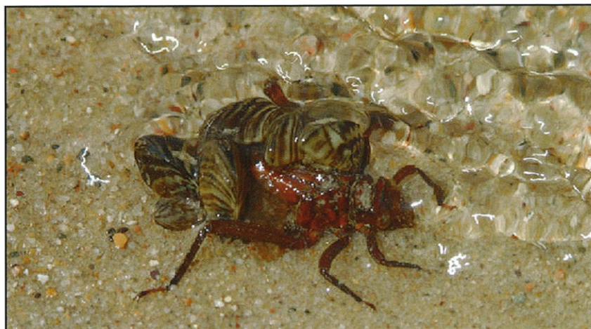
Figura 1. Fijación de individuos adultos de D. polymorpha en la zona dorsal de una larva de libélula.

Estas actuaciones se pueden dividir en dos vías principales: las que van orientadas a ampliar el conocimiento de la especie en sí, de su comportamiento biológico, conductas reproductivas, etc. Y aquellas orientadas a ampliar el conocimiento de nuevas técnicas que permitan el tratamiento correctivo o preventivo de la plaga.