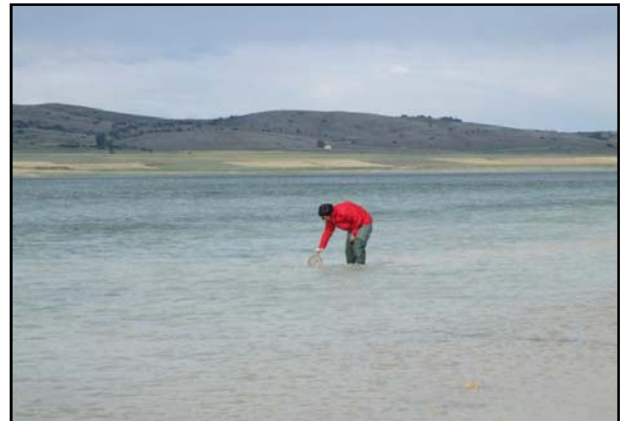
Imagen de la toma de muestras