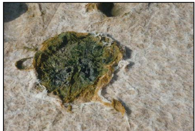
Restos de vegetación bajo la capa de sales a finales de verano de 2009