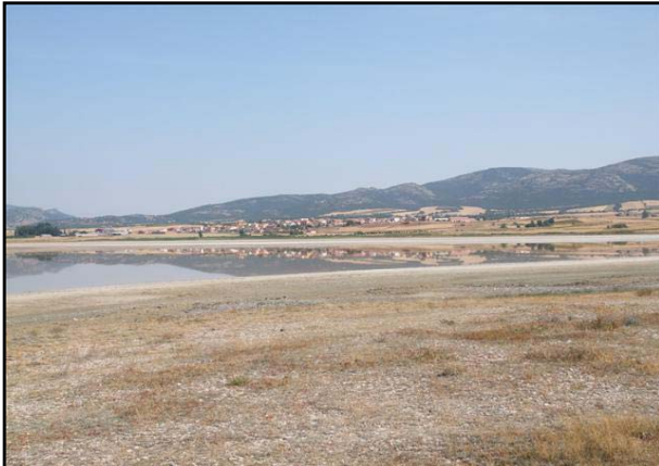
Vista de la zona litoral del lago en 2008