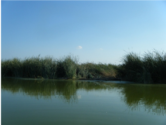
Vista del cinturón de helófitos