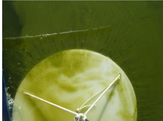
Imagen del disco de Secchi en la que se puede apreciar el color verde de las aguas debido al bloom algal