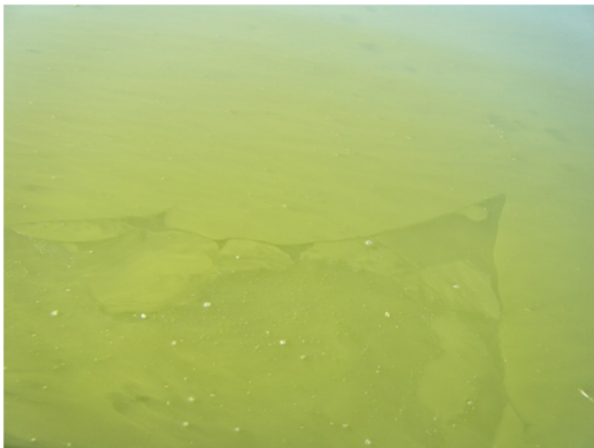
Color verde de las aguas