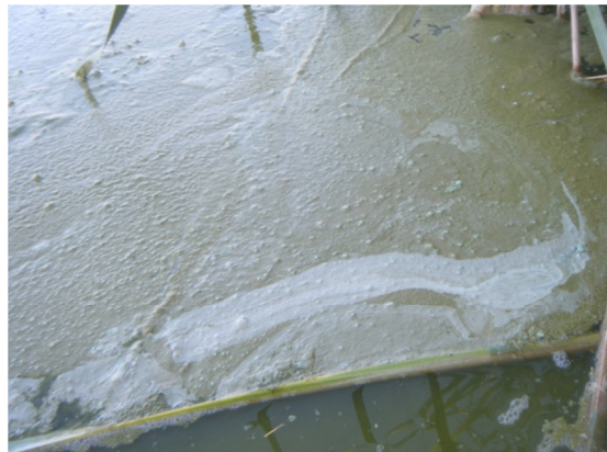
Acumulación de materia orgánica en la zona litoral