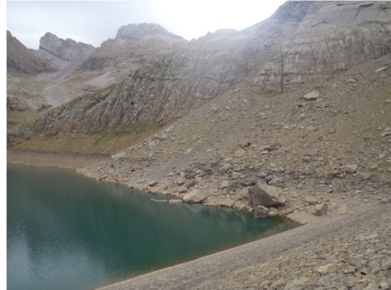
Imagen del litoral.