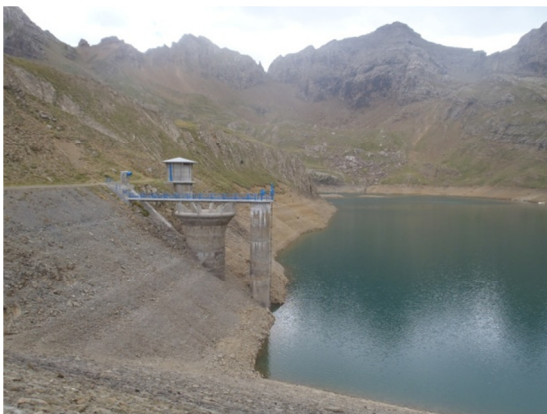
Vista de la torre de captación y de parte de la presa.