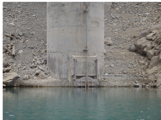
Vista de la torre de captación y del sustrato en la zona litoral de la presa.