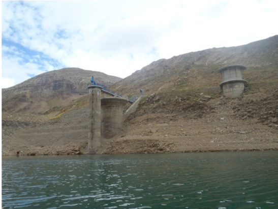
Imagen de la torre de captación en el margen derecho, puede apreciarse el bajo nivel de agua en la fecha de muestreo